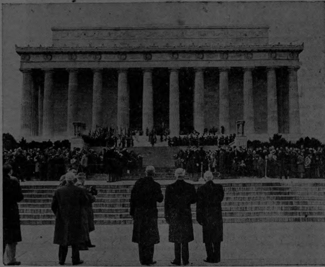
(USIS)—El Presidente Harry S. Truman, de los Estados Unidos de América, rinde tributo a la memoria de Abraham Lincoln, 16º Presidente de los Estados Unidos, en las ceremonias efectuadas ante el Monumento a Lincoln, en Washington, D.C.

circulación lo había llevado hasta el extremo de querer meter en cintura a un servicio que por su naturaleza no cabe en ninguna faja ni está bien que tenga ataduras. Mas con las críticas que se han producido al rededor del asunto, los tribunales tienen ya una orientación que permitirá enmendar un yerro tamaño como un gigante. Amén.