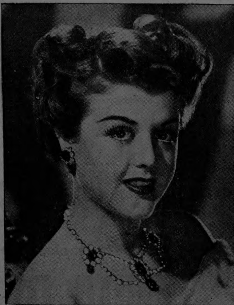
Angela Lansbury, actriz de la Metro Goldwyn Mayer

ANGELA LANSBURY ESTA APRENDIENDO A COSER